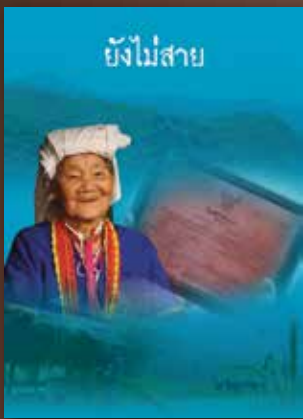
YouTube ยังไม่สาย