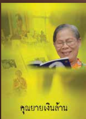
YouTube คุณยายเงินล้าน

ภาพยนตร์สารคดีเพื่อเผยแพร่คุณธรรม จริยธรรมพื้นฐานในสังคมไทย 5 ประการ อันได้แก่ 1. ซื่อตรง (“ยังไม่สาย”) 2. มีวินัย (“ผ้าอนามัยไฮโซ”) 3. เสียสละเพื่อส่วนรวม (“คุณยายเงินล้าน”) 4. พอเพียง (“ต้นแบบชีวิตพอเพียง”) และ 5. รักน้สิ่งแวดลอม (“มีบ้านสอน”) เพื่อเผยแพร่ประชาสัมพันธ์และเป็นส่วนหนึ่งของกลไกในการขับเคลื่อนให้เกิดคุณธรรม จริยธรรมในสังคมไทย