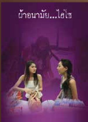
YouTube ผ้าอนามัยไฮโซ

ภาพยนตร์สารคดีเพื่อเผยแพร่คุณธรรม จริยธรรมพื้นฐานในสังคมไทย 5 ประการ อันได้แก่ 1. ซื่อตรง (“ยังไม่สาย”) 2. มีวินัย (“ผ้าอนามัยไฮโซ”) 3. เสียสละเพื่อส่วนรวม (“คุณยายเงินล้าน”) 4. พอเพียง (“ต้นแบบชีวิตพอเพียง”) และ 5. รักน้สิ่งแวดลอม (“มีบ้านสอน”) เพื่อเผยแพร่ประชาสัมพันธ์และเป็นส่วนหนึ่งของกลไกในการขับเคลื่อนให้เกิดคุณธรรม จริยธรรมในสังคมไทย