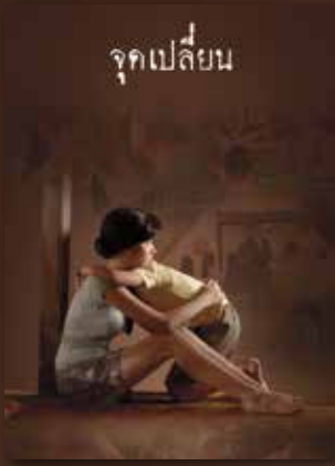
YouTube จุดเปลี่ยน