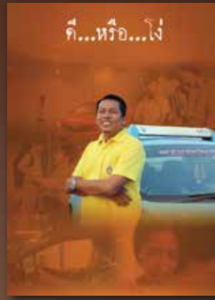
YouTube คือหรือไ้