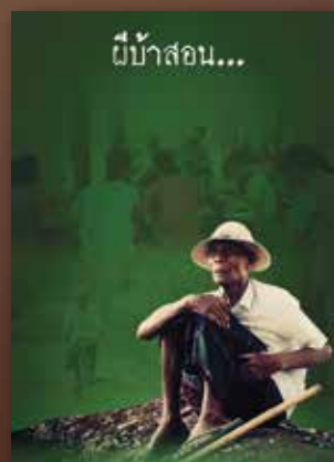
YouTube มีบ้านสอน