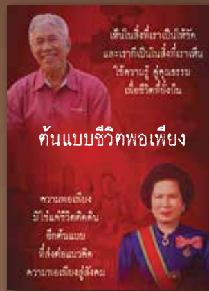
YouTube ต้นแบบชีวิตพอเพียง