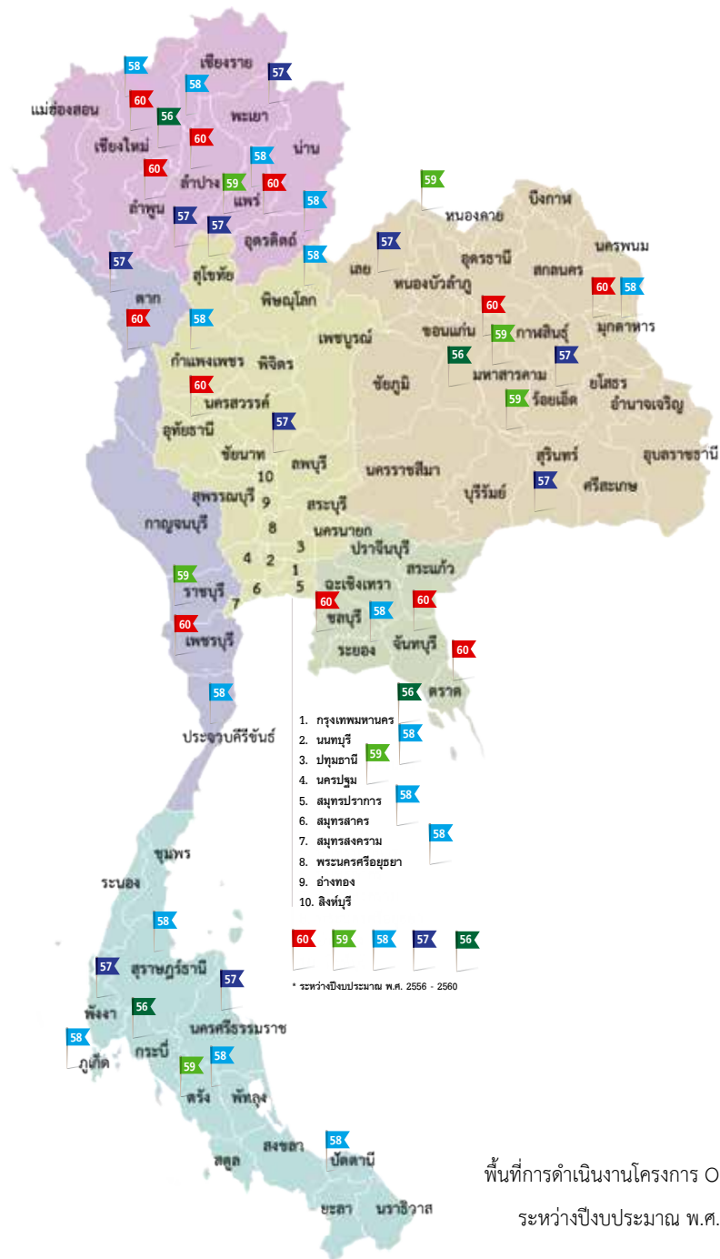
พื้นที่การดำเนินงานโครงการ Ombudsman Care ระหว่างปีงบประมาณ พ.ศ. 2556 - 2560

ในปีงบประมาณ 2561 (ตั้งแต่เดือนตุลาคม 2560 – เดือนกันยายน 2561) สำนักงานได้มีการกำหนดแผนปฏิบัติงานในโครงการ/กิจกรรมต่าง ๆ ที่จะทำการลงพื้นที่ในจังหวัดต่าง ๆ ดังนี้