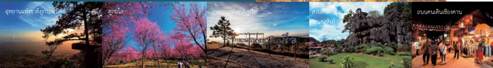
อุทยานแห่งชาติภูกระดึง