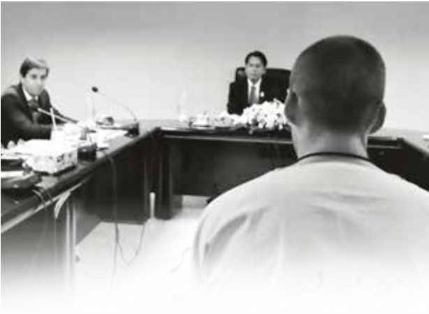
ผู้ตรวจการแผ่นดินมอบหมายให้เจ้าหน้าที่สอบสวนลงพื้นที่ตรวจสอบข้อเท็จจริง พร้อมกับผู้แทนองค์กรด้านสิทธิมนุษยชนของประเทศไทย ณ เรือนจำของประเทศไทย ที่ผู้ต้องขังสัญชาติยูเครนที่ถูกคุมขังอยู่

สำนักงานผู้ตรวจการแผ่นดินได้ประสานกับสถานเอกอัครราชทูตยูเครนประจำประเทศไทย และหน่วยงานที่เกี่ยวข้อง (กรมคุ้มครองสิทธิและเสรีภาพ และกรมราชทัณฑ์) เพื่อร่วมประชุมหารือแนวทางการแก้ไขปัญหา ปราบกฏผลดังนี้