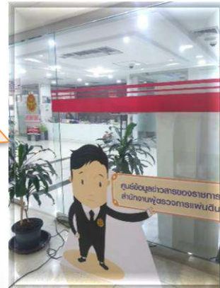
บริเวณโถงรับเรื่อง ร้องเรียน/ประชาชน ที่มาติดต่อ