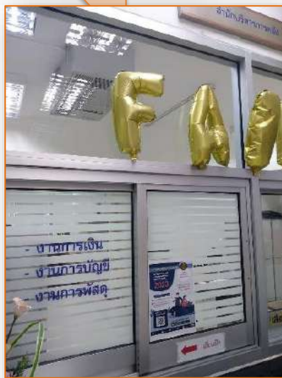
บริเวณช่องติดต่อรับเงิน/เช็ค ของสำนักงานฯ สำนักบริหารการคลัง

2.9 การส่งเสริมค่านิยมร่วม FAIRS ภายในสำนักงานผู้ตรวจการแผ่นดิน เพื่อส่งเสริมให้พนักงานและลูกจ้างของสำนักงานฯ มีจิตสำนึกและพฤติกรรมที่พึงประสงค์นำไปสู่การพัฒนาองค์กรให้บรรลุเป้าหมาย